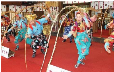
H24・5・27 金沢市宇多須神社・拝殿